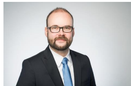
Staatsminister Christian Piwarz

Ziel der Woche ist, die Kindertagespflege erlebbar zu machen und in die öffentliche Aufmerksamkeit zu rücken . Kindertagespflegepersonen werden sich auf vielfältige Weise an der Woche beteiligen: