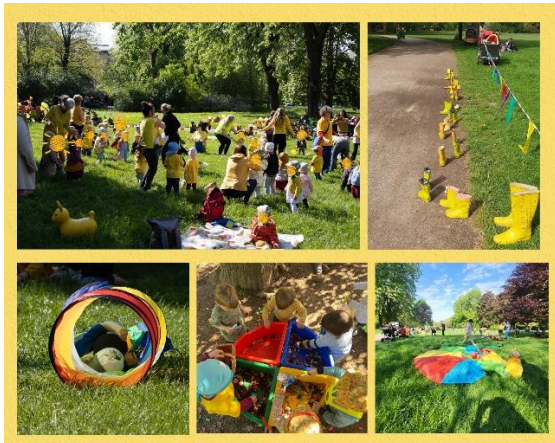
Aktionstag „Kindertagespflege? Selbstverständlich!“ im Mai 2023 im Friedenspark in Leipzig

Im Jahr 2024 wird die Aktionswoche der Tagesmütter- und väter wieder um die besondere Aktion „Kindertagespflege? Selbstverständlich!“ erweitert: Am 29. Mai 2024 sind alle Kindertagespflegepersonen Sachsens eingeladen, mit ihren Kindern in die Öffentlichkeit zu gehen. Unter dem Motto „Kindertagespflege ist so selbstverständlich wie das Schein der Sonne“ werden sachsenweit Tageseltern und ihre betreuten Kinder in Gelb leuchten und öffentlich auf die Kindertagespflege aufmerksam machen. Dass dies wunderbar funktioniert und die Aufmerksamkeit im öffentlichen Raum bündelt, zeigen die letzten Jahre.