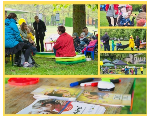
Aktionstag „Kindertagespflege? Selbstverständlich!“ im Mai 2023 auf der Küchwaldwiese in Chemnitz