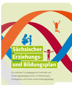
Bild: Screenshot Bildungsplan